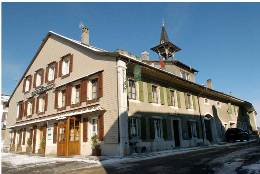
L'hôtel-restaurant de La Couronne est fermé depuis plus d'une année.

Economie Les autorités sont décidées à remettre en location l'établissement qui est au cœur d'une bataille juridique.